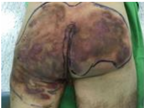
Kép. Kezelés előtt

A szakdolgozók munkáját is jelentősen megkönnyíti, hiszen egy helyesen felhelyezett VivanoTec rendszer több napon át tehermentesíti az ápolót és a beteget a kötéscsere alól, és a kötés eltávolítását követően egy váladékmentes, tiszta sebalappal találkozunk.”