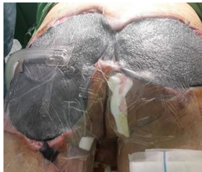
Kép. Jól funkcionáló Vivano kötés