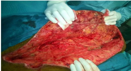
Kép. Vivano alkalmazása előtt

„Számunkra és Betegünk számára is a gyógyulás volt a legfontosabb, hiszen az otthon melegében várta őt újszülött gyermeke! Az édesanya előtt állt egy út, ami oda vezet, hogy egy kis apró emberi lény szeretetteljes családban, édesanyja mellett egészséges, boldog gyermekkorban cseperedhet fel! Osztályunk valamennyi dolgozója és a Vivano negatívnyomás terápiaival történő sebkezelés e nemese célhoz járult hozzá!”