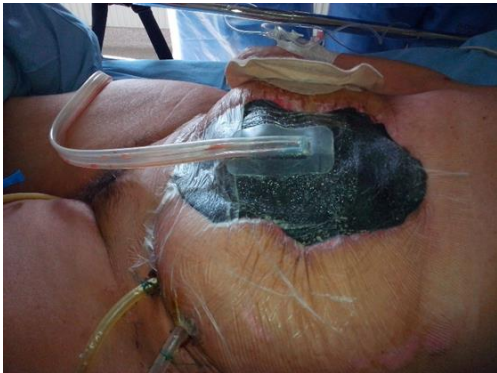
Kép. „Nyitott has” kezelés Vivanoval

Kezdetben mi ápolók idegenkedtünk a készüléktől, fenntartásaink voltak vele kapcsolatban. Féltük, hogy ha hibát jelez mit fogunk tenni. Ezek a negatív érzések hamar tovaszálltak. Csak jó tapasztalataink vannak. Eljutottunk oda, hogy ha az orvos még gondolkozik legyen Vivano vagy ne legyen, mi próbáljuk meggyőzni miért lenne jó!”