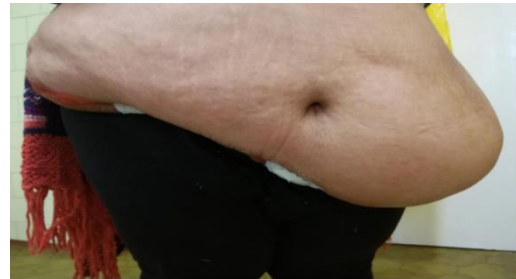
Kép. Gyógyult állapot

Pályázó: Meleg Mihályné 1 , Paragh Lászlóné 2