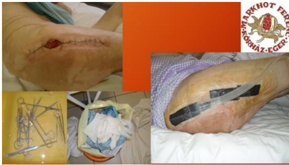
Kép. Sikeres Vivano kezelés képe

Amikor már a reményvesztettség jellemzett minden dolgozót, kaptunk egy gyors és jelentős segítséget: Vivano NPWT kezelést indítottunk.”