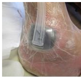
Kép. Vivano kezelés alatt