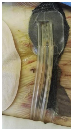
Vivano alkalmazása sztómás betegnél (első applikáció)

„Az egészségügyben eltöltött közel 30 éves munkánk során sok érdekes esettel találkoztunk. Ezen eset kapcsán az egyik legsikeresebb, legtanulságosabb betegellátásnak lehettünk részesei. Tapasztalatot szereztünk a modern sebészeti betegellátásban és valóban siker élményünk volt. A VivanoTec készülék alkalmazása mind a beteg, mind az ellátó szakdolgozók számára egyszerű, kényelmes eljárás volt. Segítette a beteg mindennapos ápolásának, ellátásának feltételeit, megakadályozta a felülfertőzéseket és ezáltal rövidítette az ápolási napok számát. A kezdeti félelmet, a motiválás és az öröm érzete váltotta fel. Orvosaink, ápolóink elhivatottsága és a VivanoTec készülék alkalmazása révén egy 30 éves hölgy kapta vissza életét.”