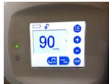
Kép. Incíziós NPWT (Vivano) alkalmazása