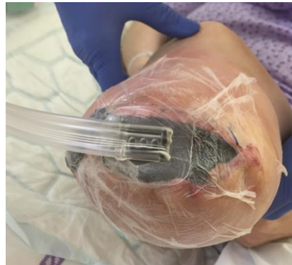
Kép. Lábszárcsonk szétnyílt sebének kezelése Vivanoval