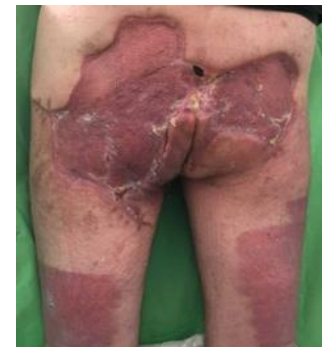
Kép. Gyógyult állapot