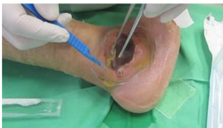
Kép: Vivano alkalmazása előtt

A szakdolgozó egészség védelme a Vivano használatával (főként a higiénia szempontjából) könnyebben megvalósul, a hagyományos kötszerek gyakori cserélgetésével ellentétben.”