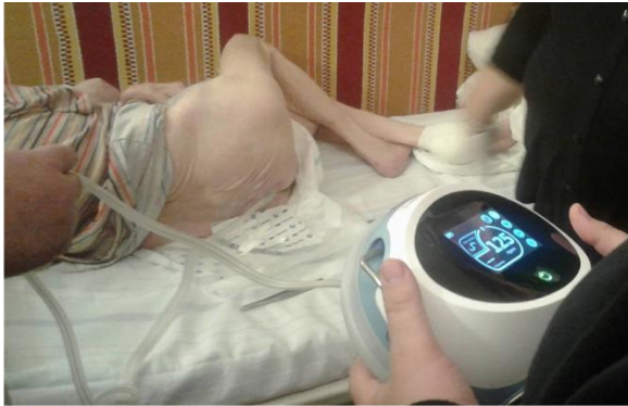
Kép. Vivano alkalmazása nyomási fekély esetén

„Hiszem, hogy ennek a kezelési formának is van létjogosultsága szociális otthoni keretek között is. Számtalan képes dokumentációval tudjuk alátámasztani ennek szükségességét. A kezelések időtartama jelentősen csökkenthető lenne, a kezelés fájdalomtalan.”