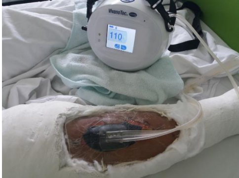
Kép. Vivano alkalmazása gipszelt végtag esetén

„ A terápia nem csodaszer, de egy lehetőség a modern sebkezelésben a sebgyógyulás súlyos szövődményeinek leküzdésében!”