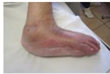
Kép. Gyógyult állapot